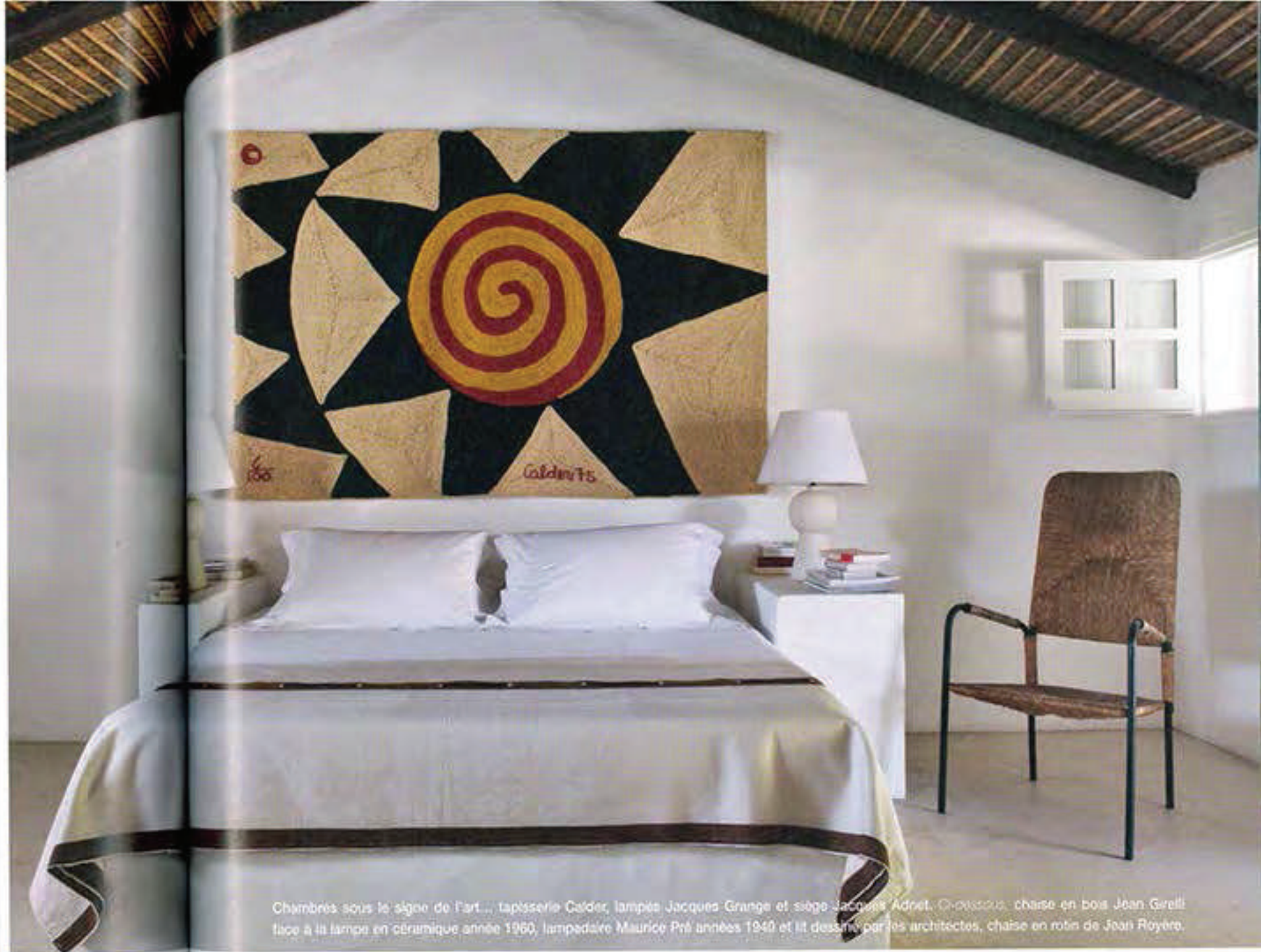
Chambres sous le signe de l'art... tapisserie Calder, lampes Jacques Grange et siège Jacques Adnet. Chaises, chaise en bois Jean Grell face à la lampe en céramique année 1960, lampadaire Maurice Pré années 1930 et lit dessiné par les architectes, chaise en rotin de Jean Royère.