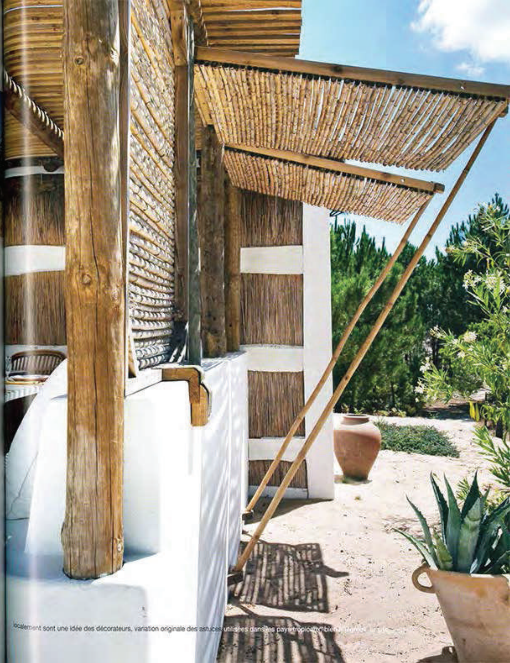
La cloison de canisses posées sur un cadre de bois et son système artisanal d'ouverture favorisent l'ombre, la vue et le passage de l'air. Ces stores fabriqués

À une heure de Lisbonne, le sable à perte de vue, la mer et les rizières avoisinantes, la lenteur du temps jusqu'à l'horizon... Comporta est le repaire week-end de la haute société lisboète et de l'intelligentsia aisée. Mais, chut, personne ici ne tient à ce que le bruit se répande. Entre Comporta et les décorateurs, l'histoire a commencé il y a une quinzaine d'années. À chaque séjour, ils éprouvaient la sensation unique de douceur diluée dans l'air, le plaisir de poser les pieds dans une nature intacte et de larguer les amarres pour une région authentique. Lorsqu'il leur a été proposé de réhabiliter une vieille maison de pêcheur, l'histoire s'est faite naturellement, comme par instinct. La construction vernaculaire posée sur la dune gardait les stigmates d'un quotidien au confort modeste. Ses pièces étriquées étaient peintes de couleurs inattendues dans le but d'égayer l'espace mais cette configuration les rendait à jamais inadaptées à notre époque. « Nous avons cassé les cloisons au profit d'une meilleure respiration », explique le duo qui y aménage quatre chambres et leurs salles de bains. Et les autres pièces, la cuisine-salle à manger, le salon ? Autour de la bâtisse d'origine et de son figuier en majesté, deux cabanes neuves de taille légèrement différentes sont construites dans la pure tradition locale, toit en paille de riz, ▶