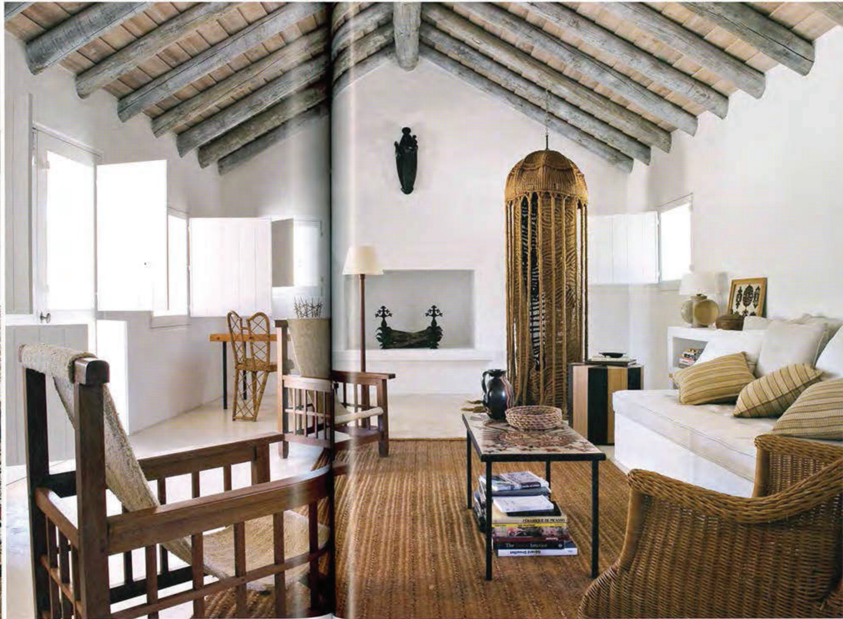
Au salon, le meilleur du design vintage du xxi e siècle. Fauteuils Mallet-Stevens, vierge de Georges Jouve au-dessus de la cheminée, guiridon bicoloré